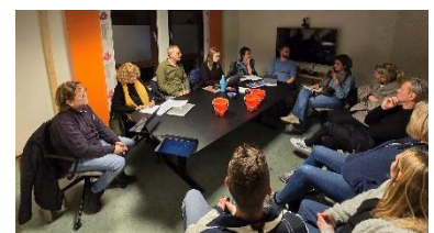
Møte med Arbeiderpartiet og SV