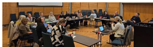
Kurs for våre flotte tillitsvalgte