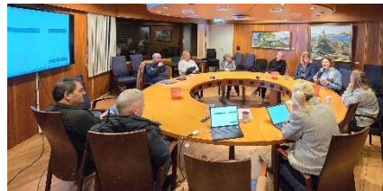
Klubbmøter på Grimstad ungdomsskole og Fevik skole