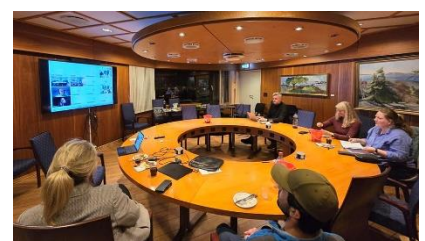
Møte med valgkomiteen