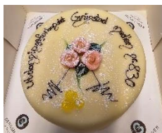
Markering av medlem nr. 830 i Eide barnehage

Middag for lokallagsstyret, tillitsvalgte, arbeidsgruppe for pensjonister og ledermedlemmer