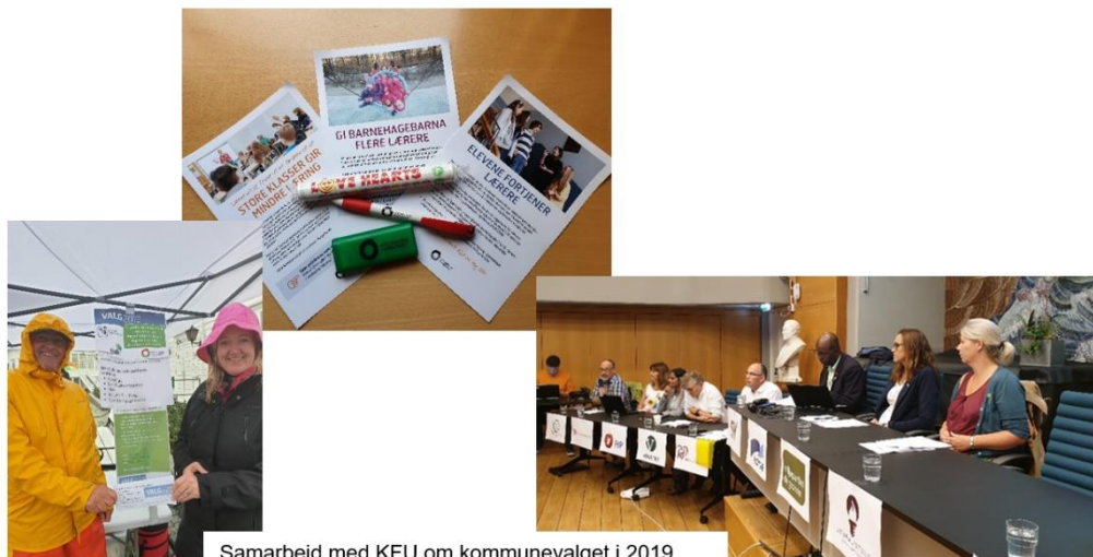
Samarbeid med KFU om kommunevalget i 2019