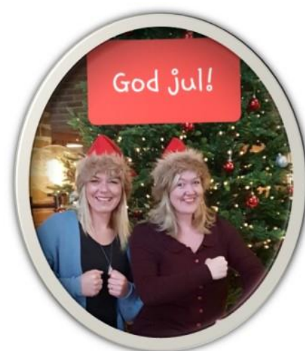
Julehilsen fra oss frikjøpte

Styret har ikke mottatt noen resolusjoner.