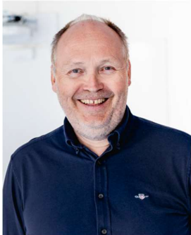
Sjur Dolve Grunnskole Fylkesstyremedlem