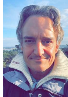
Mattis Uthberg Hambo Grunnskole Fylkesstyremedlem