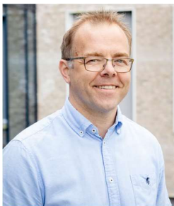
Knut Olav Farbrot Grunnskole Fylkesstyremedlem