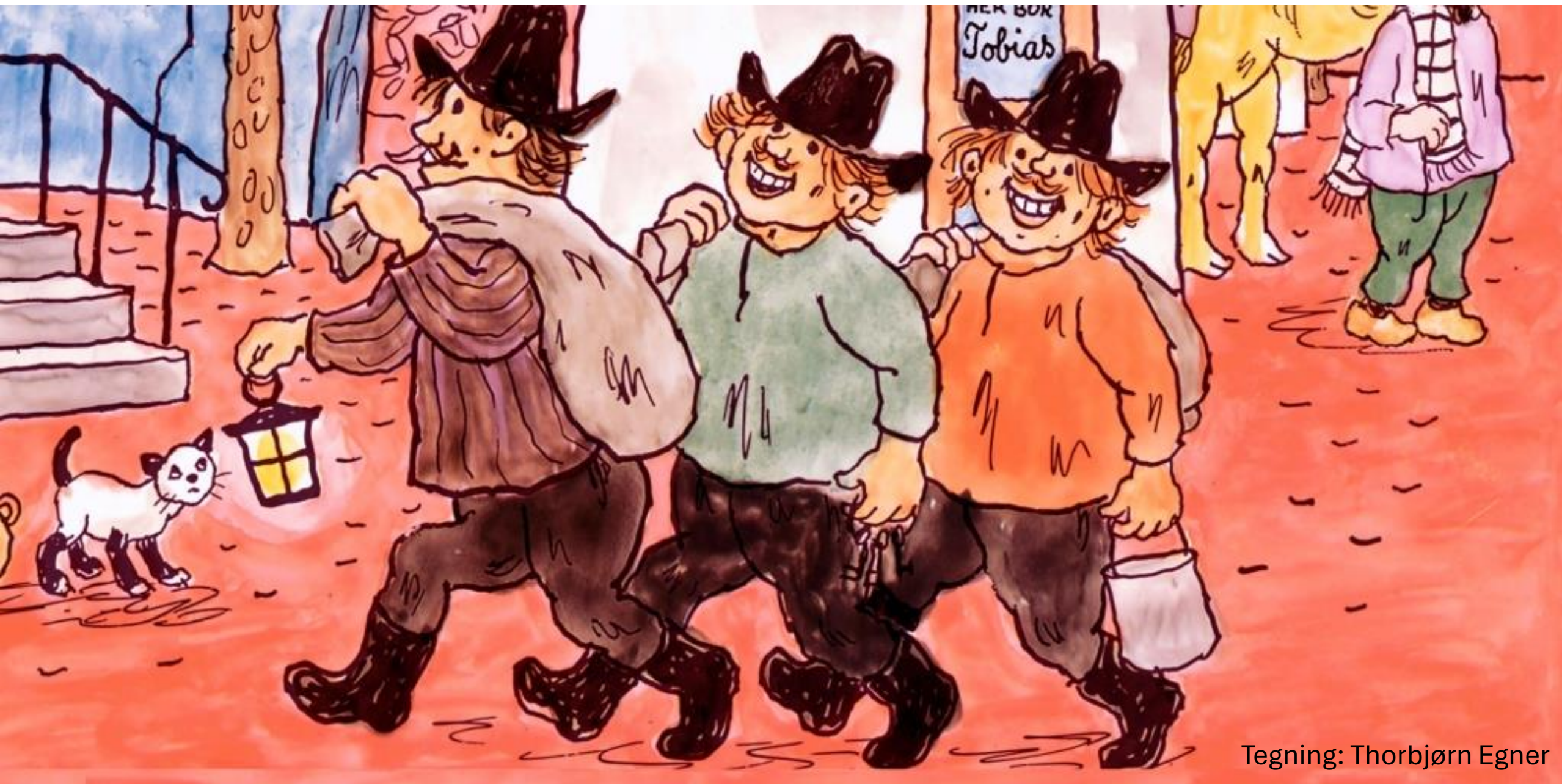
Tegning: Thorbjørn Egner