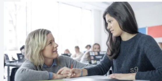
Det er særlig overgangen mellom ungdomsskolen og videregående som er utfordrende for elever med behov for særskilt språkopplæring.

Både norske myndigheter og lærerprofesjonen har et ansvar for å sikre at alle nyankomne på best mulig måte får utdanning og opplæring.