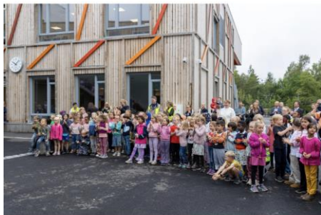
28 august 2023 Åpning av Åsgård skole

Vi som jobber på Åsgård skole er fortvilet over manglende investeringer i kommunen på læremidler