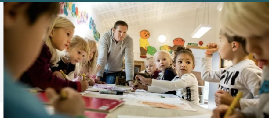
Undersøkelsen blant barnehagestyrere bekrefter alvorlige bemanningsutfordringer i barnehagen.