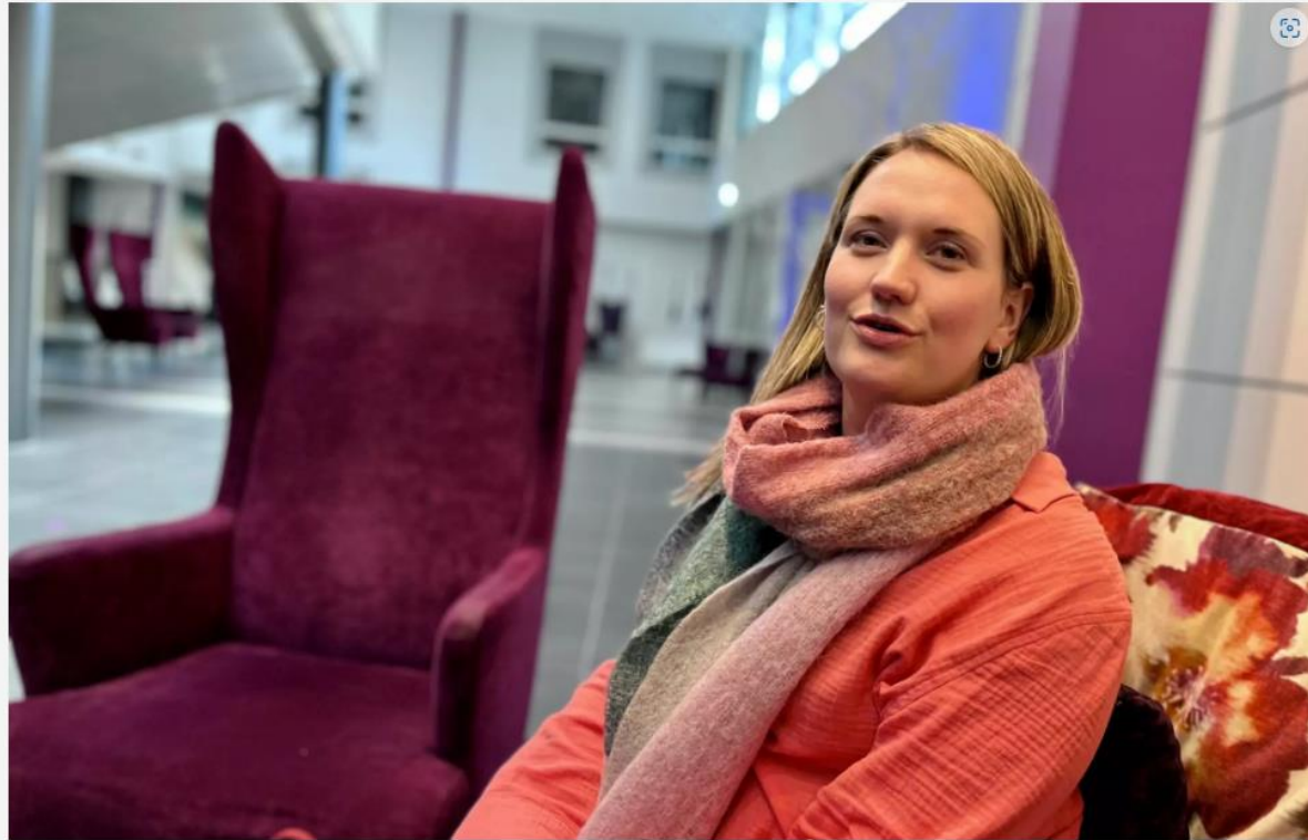
Lisa Beth Waterloo Laugtug