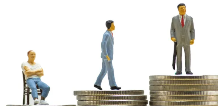
Illustrasjonsfoto; Adobe Stock