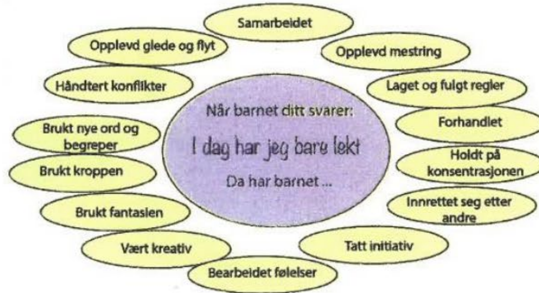
Figur 2.14: Vår versjon av en figur som brukes i litt ulike varianter på flere barnehagers hjemmesider.

Den frie bevegelsesleken: Lek i tidlig barnealder gir det beste grunnlaget for senere læring og vekst (Lunde og Brodal 2022)