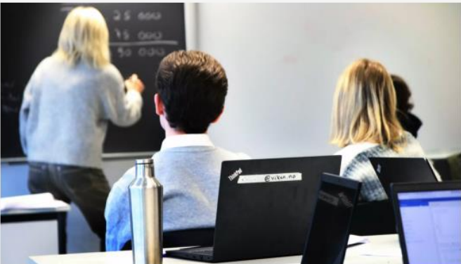
Skoler landet over sliter med å få tak i nok bemanning.