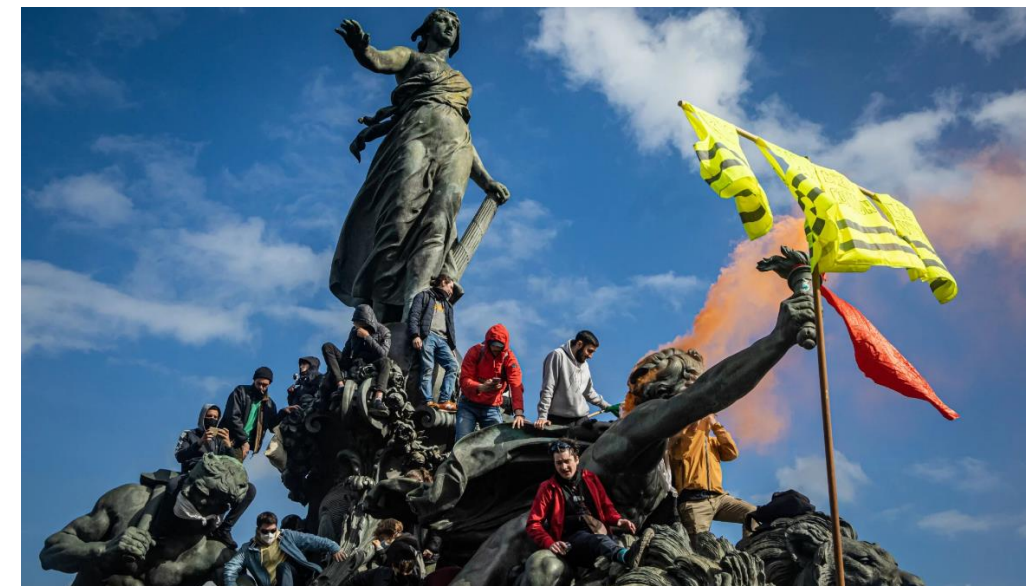
Heving av pensjonsalderen har medført store demonstrasjoner i Frankrike. I Norge hersker stillheten, skriver Kai Nilsen. Vis mer