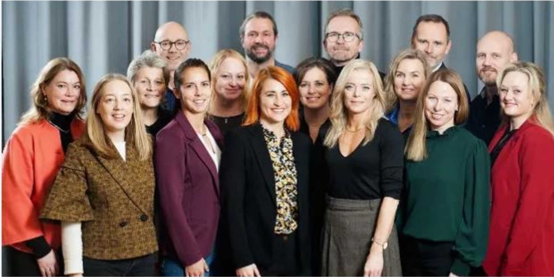
Sentralstyret 2024-2027.