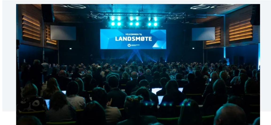
Landsmøtet i Utdanningsforbundet fordømmer på det sterkaste krig og terror mot sivile.