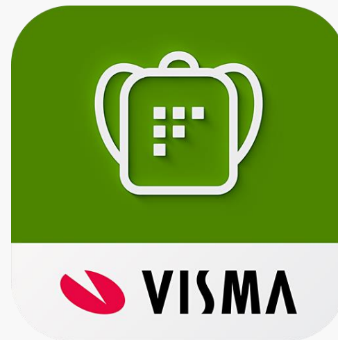
-Visma Min skole app