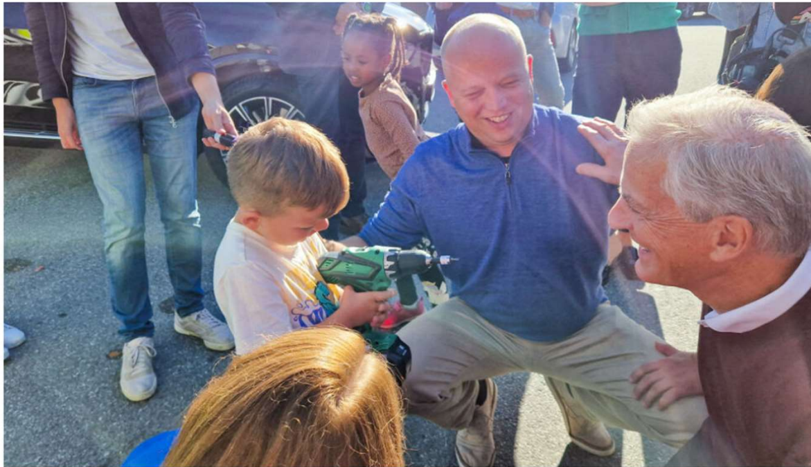
Statsminister Jonas Gahr Støre (Ap) og finansminister Trygve Slagsvold Vedum (Sp) i St. Olavs barnehage i Sarpsborg tirsdag morgen.

Regjeringen kommer med en kjempegave til småbarnsforeldrene i valgkampinnspurten. Ny makspris i barnehage settes ned fra 3000 til 2000 kroner fra 1. august neste år. - En historisk dag for norske familier, sier kunnskapsminister Tonje Brenna.