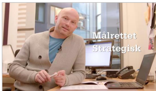
Fra filmen om å jobbe strategisk