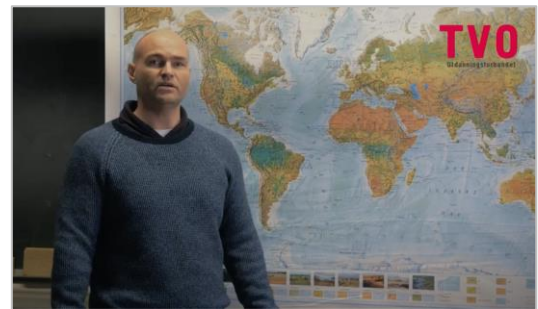
Fra filmen om arbeid internasjonalt