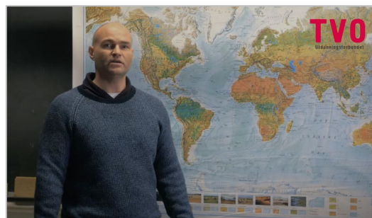
Fra filmen om arbeid internasjonalt