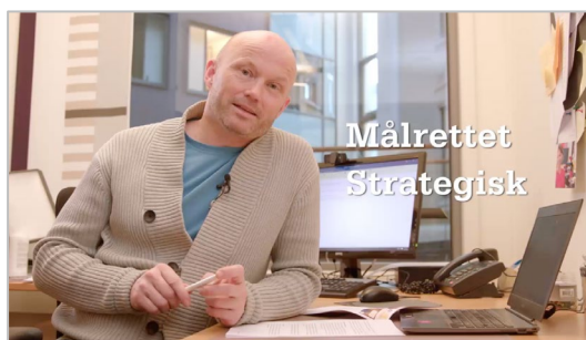
Fra filmen om å jobbe strategisk